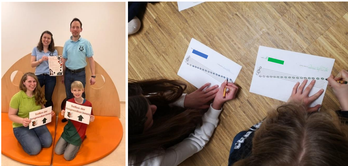
Abbildung 5: Eindrücke des 1. Treffens

Um den Kindern und Jugendlichen das Ansprechen der Vereinsmitglieder zu erleichtern, trugen diese ihre Musikkapellen-T-Shirts. Auf der Rückseite befinden sich eine Abbildung des jeweiligen Instruments sowie der Vorname. Vorab wurde eine Beschilderung im Gebäude angebracht und den Personen die Räumlichkeiten (Garderobe, Aufenthaltsraum, WC) gezeigt.