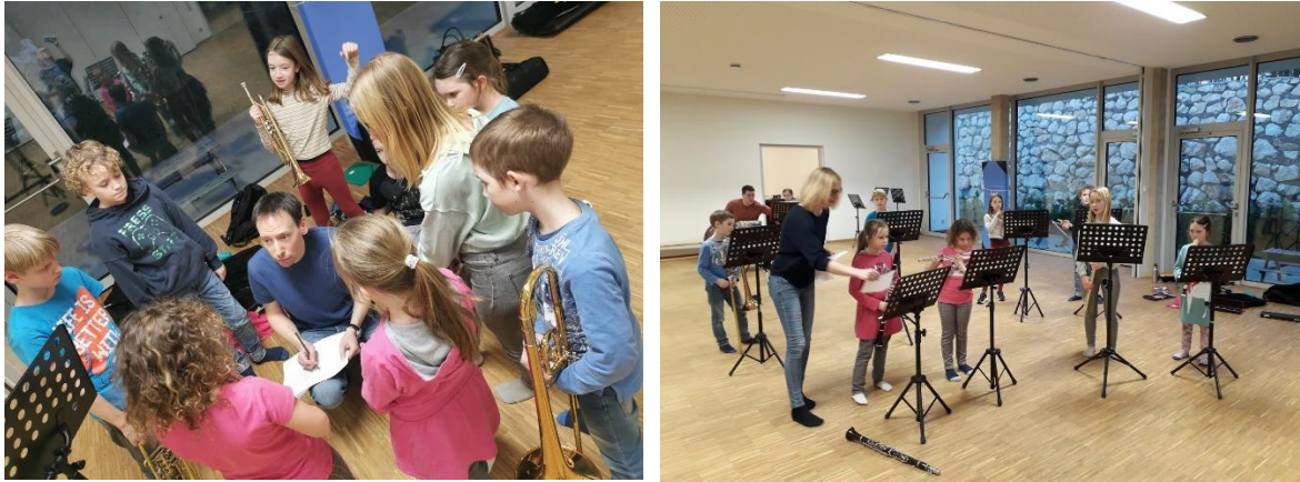
Abbildung 7: gemeinsames Musizieren im 3. Treffen

Die Anwesenheit und Entwicklungstendenz sehen bis jetzt so aus: