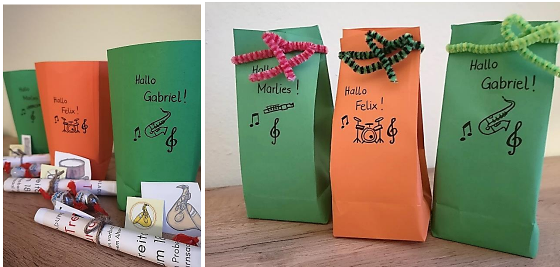
Abbildung 3: Willkommensgruß Jungmusiker:innen

ein Sticker des Österreichischen Blasmusikverbandes passend zu dem jeweiligen Instrument. Weiters wurden die Einladung sowie eine süße Kleinigkeit dazugelegt.