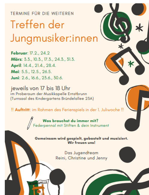
Abbildung 9: Elterninformation

Jeder Erziehungsberechtigte bzw. jedes Kind erhielt eine Zusammenfassung der wichtigsten Informationen in ausgedruckter Form: Ab der zweiten Stunde wird das Federpennal benötigt, ab der dritten Einheit das eigene