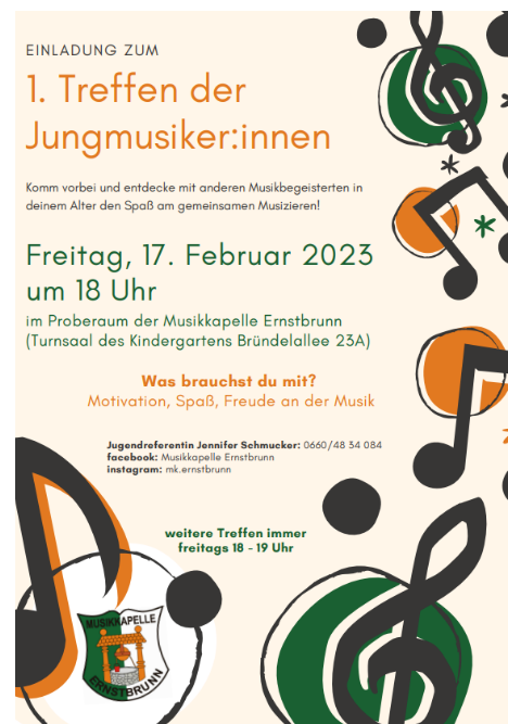
Abbildung 2: Einladung des 1. Treffens

Da die Zahl der Musizierenden bekannt war, mussten die Namen der Personen eruiert werden. Weil aus Datenschutzgründen keine Informationen genannt werden dürfen, wurde eine andere Strategie verfolgt. Ab dem Schuljahr 2022/23 besuchten die Vereinsmusiker:innen Auftritte von Bläsergruppen in der Musikschule, um Informationen in direktem Kontakt herauszufinden. Mit Hilfe zahlreicher Gespräche und Kontakte waren schlussendlich bis Anfang Jänner alle Namen und Wohnorte bekannt. Ab diesem Zeitpunkt wurde begonnen, die Jungmusiker:innen persönlich zu einem ersten gemeinsamen Treffen einzuladen. Bei Schlaginstrumenten fiel die Auswahl auf Personen, die bereits mehrjährige Erfahrung besitzen.