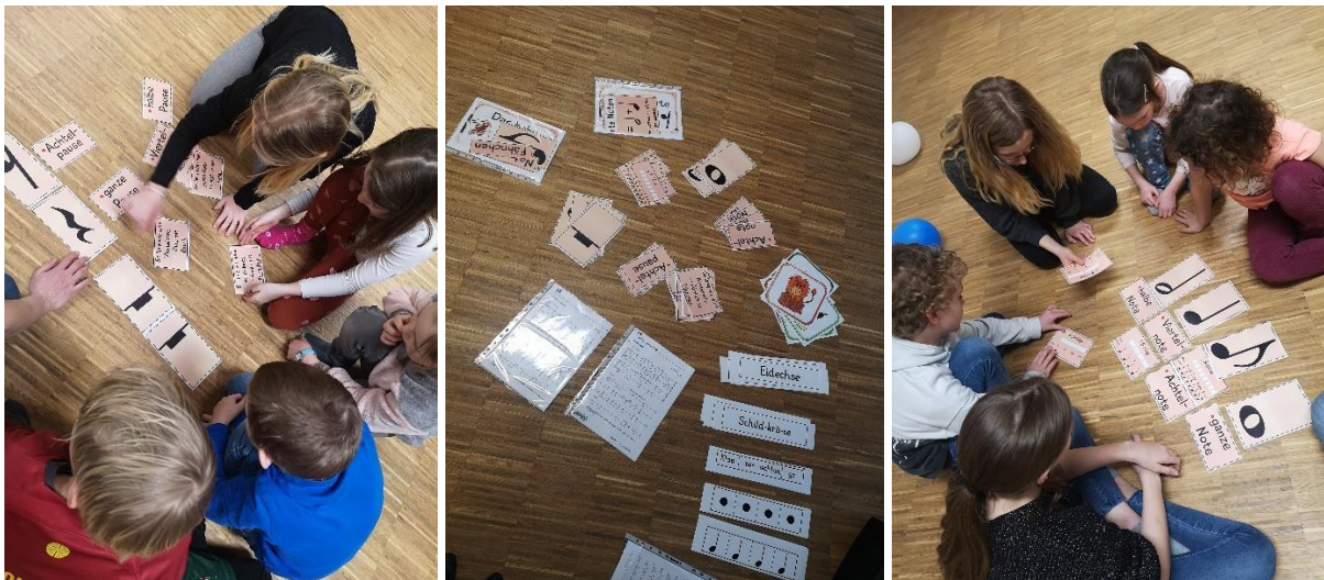
Abbildung 6: Noten- und Pausenwerte erkennen im 2. Treffen