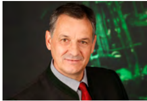
Erich Riegler Präsident Österreichischer Blasmusikverband