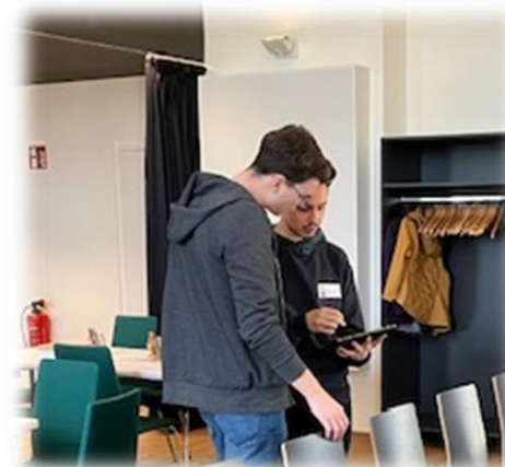
Check der vorhandenen Technik im Saal