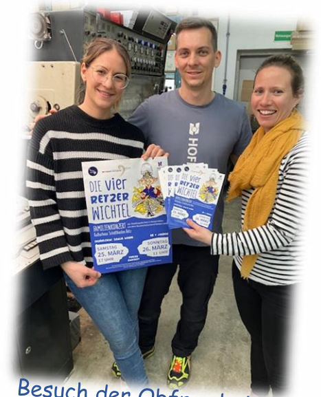
Besuch der Obfrau bei den Sponsoren