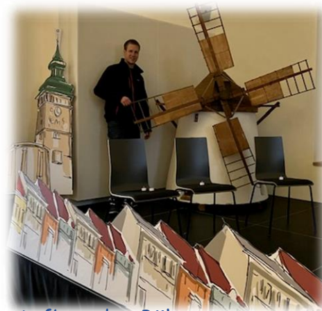
Aufbau der Bühne