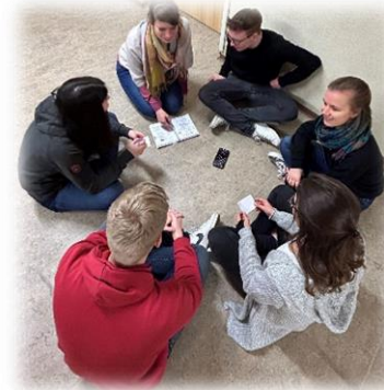
Absprache im Jugendteam