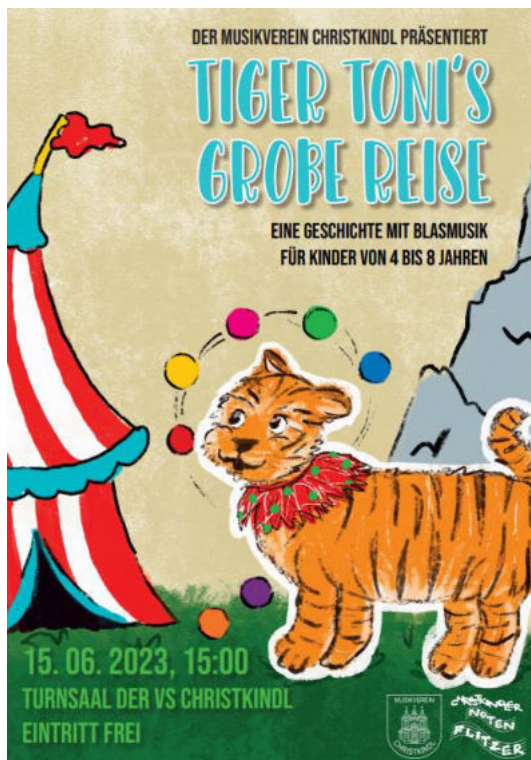
Abbildung 1: fiktives Plakat

Da ich mir als zusätzliches Ziel gesetzt hatte, dass das Gestaltungskonzept von „Tiger Tonis große Reise“ auch von anderen Musikvereinen realisiert gekonnt werden sollte, war eine entsprechend übersichtliche Niederschrift wichtig.