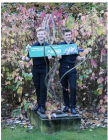
Schlag auf Schlag