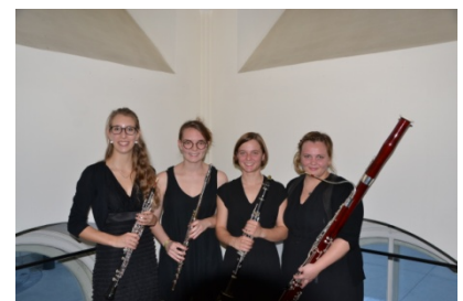
LIGNA AUREA QUARTETT