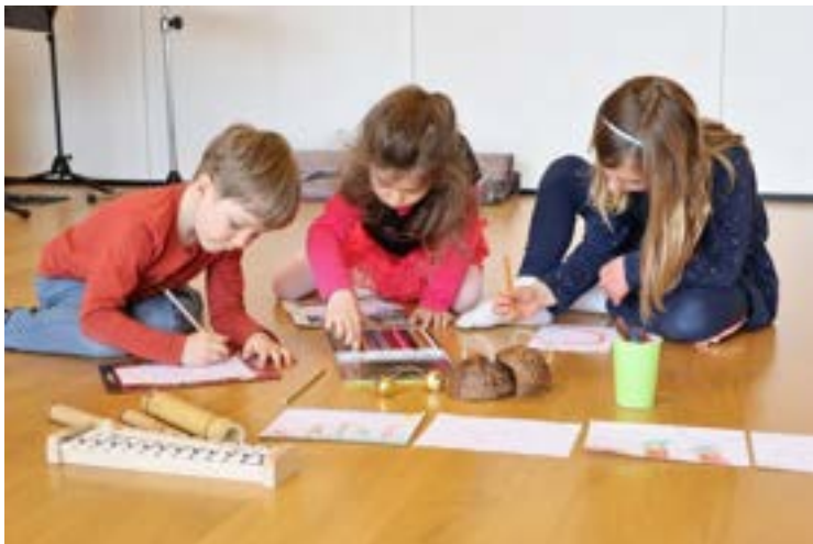
Bild 11: Erarbeiten einer Klanggeschichte

Die Kinder lernen dabei Musikinstrumenten einen Charakter zuzuordnen/sie mit bestimmten Geräuschen zu assoziieren (z.B. lautes Trommeln – Gewitter, Klanghölzer – schnelles Laufen, Glockenspiel – Sonnenschein). Das gemeinsame Musizieren (Einhalten von Pausen, richtige Einsätze, aufeinander Hören) wird geschult und Kreativität und Teamfähigkeit werden gefördert.